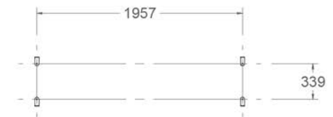
distancias anclajes A-A